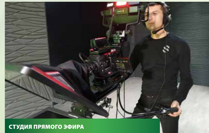
СТУДИЯ ПРЯМОГО ЭФИРА