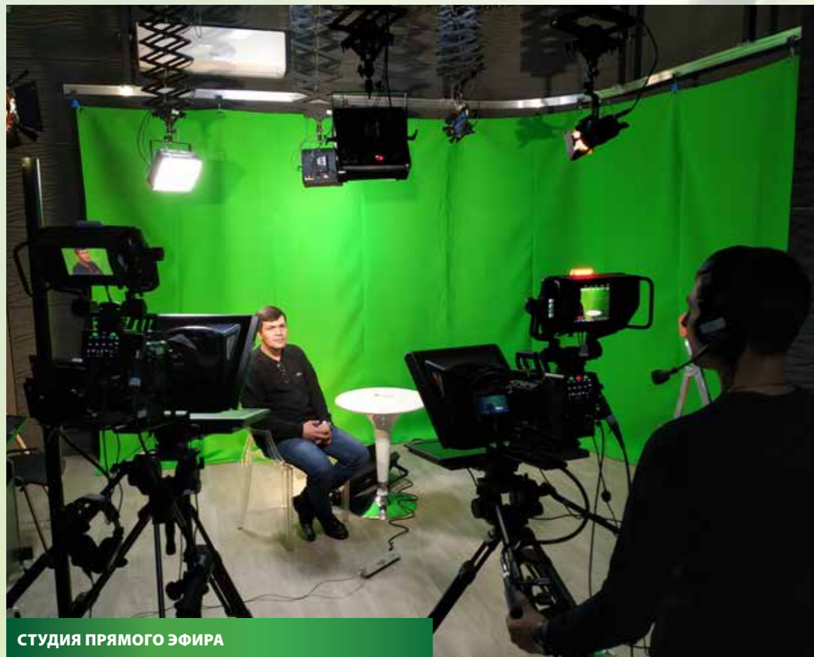
СТУДИЯ ПРЯМОГО ЭФИРА

Мы реализуем все задачи на базе собственного парка необходимой техники и программного обеспечения - поэтому всегда уверены в качестве.