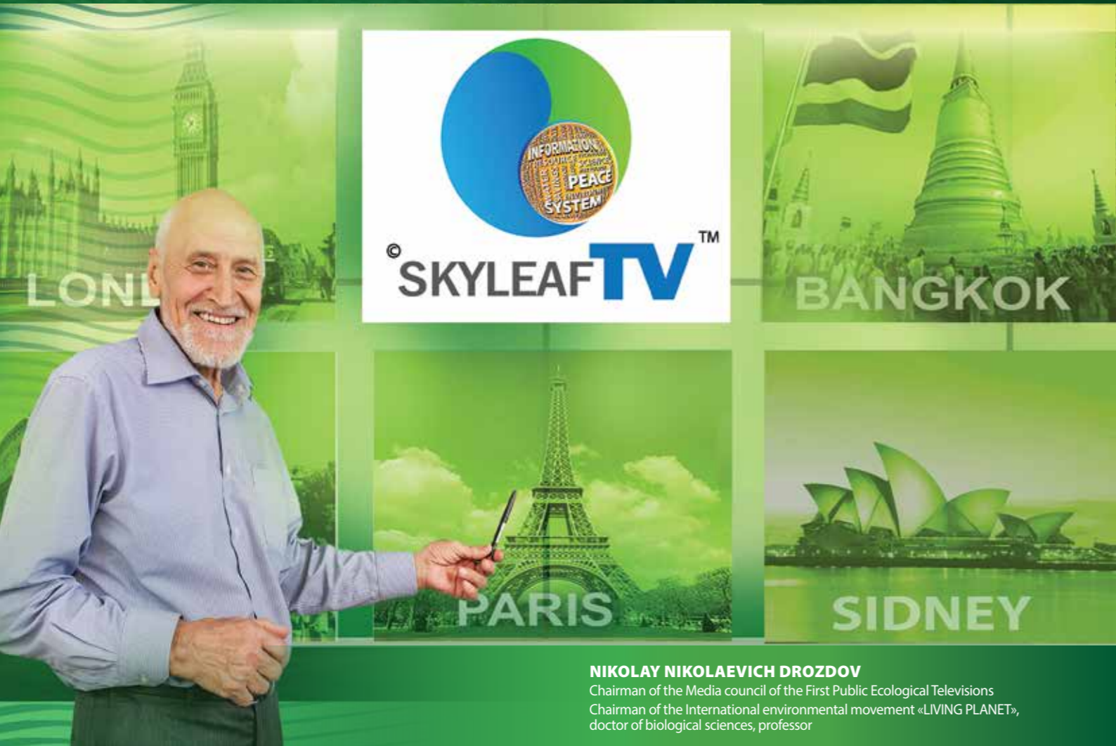
NIKOLAY NIKOLAEVICH DROZDOV Chairman of the Media council of the First Public Ecological Televisions Chairman of the International environmental movement «LIVING PLANET», doctor of biological sciences, professor

In St. Petersburg at the headquarters of the Russian Geographical Society on April 27, 2018, the President of the Russian Federation Vladimir Vladimirovich Putin held the tenth anniversary meeting Board of Trustees of the Russian Geographical Society. The meeting participants summed up the work organizations for 2017 and presented the best