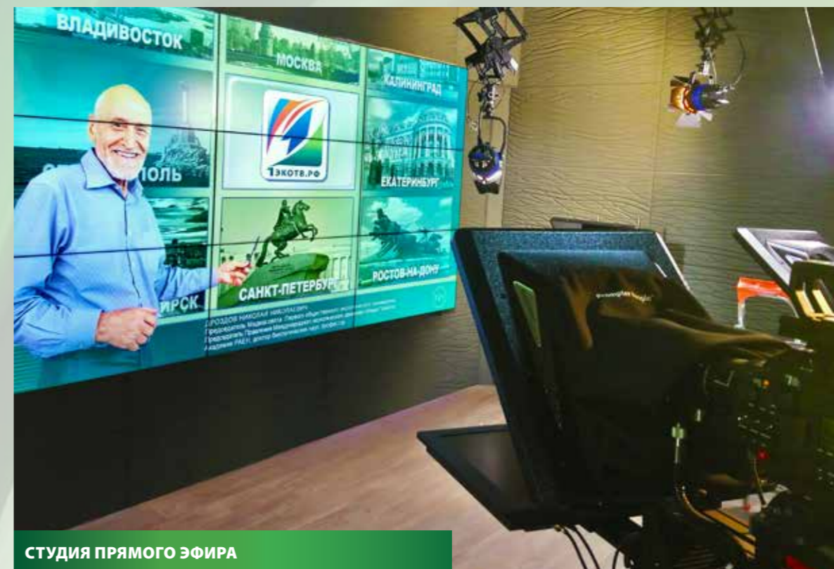
СТУДИЯ ПРЯМОГО ЭФИРА

Для детей программы готовятся в виде анимационных и игровых фильмов, а для молодёжной аудитории – спортивные, музыкальные, познавательные, направленные на пропаганду здорового образа жизни.